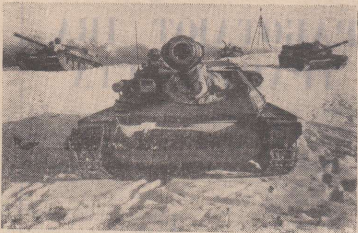
На учениях. Атакуют артиллерийские самоходные установки подразделения воздушно-десантных войск.